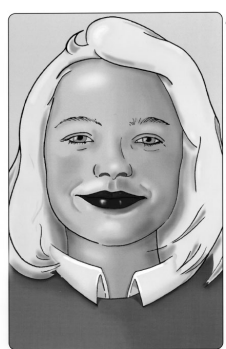
Flicka 1 Hon ler lätt Läpparna dragna åt sidan och stängda