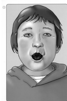
Pojke 1 Kyssmun Läpparna rundade och stängda